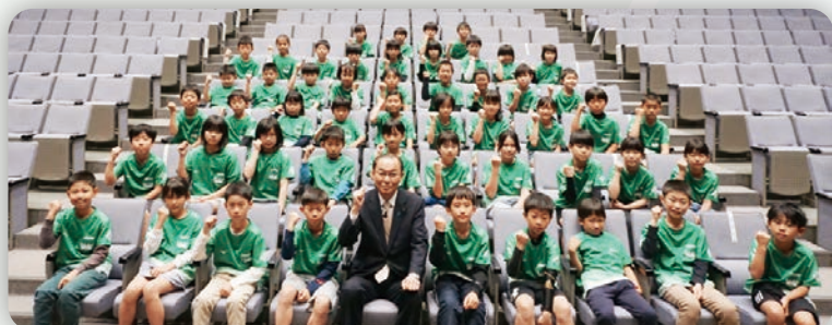
※松尾競技力向上対策本部長(副知事)と記念撮影