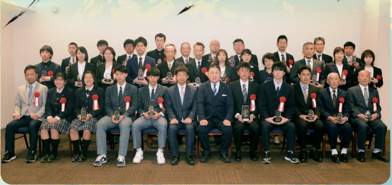
令和4年度公益財団法人島根県スポーツ協会表彰式 令和5年3月22日 於:ホテル白鳥