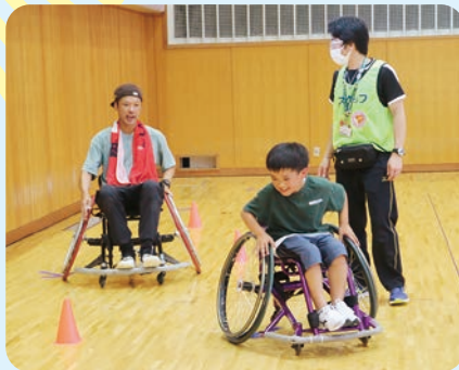
車いすスラローム