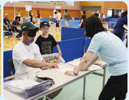
視聴覚障害者情報センター展示

今回初めての試みとして、オープニングイベント 「みなと子ども園の園児さんたちによるダンス」を行っていただきました。 元気いっぱい踊っていただき、にぎやかな幕開けとなりました。