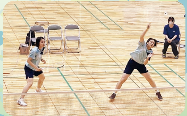
バドミントン競技 成年女子