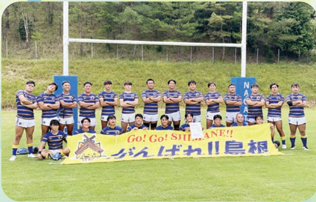
ラグビーフットボール競技 少年男子